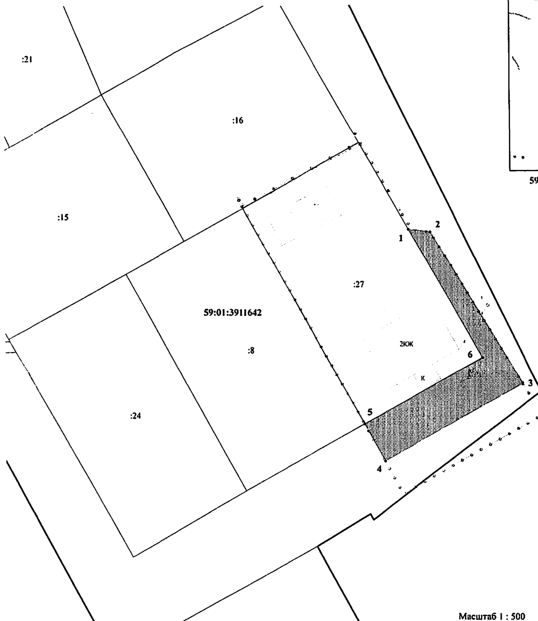
Масштаб 1 : 500